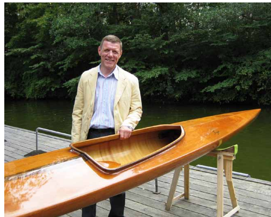
Kaj, den stolte ejer af en Struer – mahognikajak

og efter en periode med økonomiske problemer pga. konkurrencen fra de nye kunstmaterialer kulfiber og kevlar (glasfiber blev aldrig nogen seriøs konkurrent, da Struerbådene altid var hurtigere), ser det ud til at virksomheden i dag lever nogenlunde trygt, efter en entusiast har overtaget den, og givet den nødvendige kapitalindsprøjtning. Den nuværende ejer har således redet den fine gamle virksomhed, ud fra et ønske om, at så fint håndværk som det der gennem årene er udviklet i Struer, ikke måtte gå til grunde. I dag er kajakbyggeriets primære produktion en meget flot havkajak, som vel nærmest må betegnes som havkajakernes Rolls Royce, selvom der stadig bygges kapkajakker på værkstedet. Det er sandsynligt, at Struers kapkajakker stadig er blandt de absolut hurtigste, men da sponsorater og kapitalinteresser har fået meget at sige i dag, kan Struer Kajak nok ikke forvente at vinde mange medaljer i tiden fremover, dertil er firmaet nok ikke stort- og økonomisk stærkt nok. Jeg har indtil nu kaldt Struer kajakkerne for mahognibåde. Det er dog ikke den hele sandhed idet en Struer kajak er bygget af flere forskellige eksotiske træ-